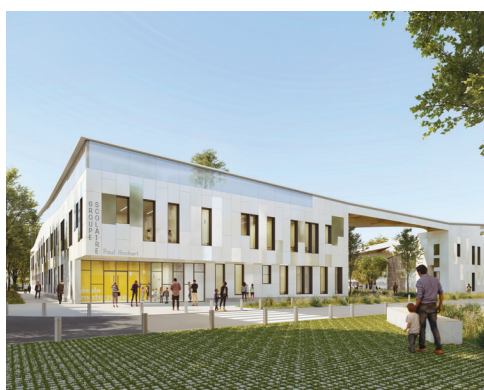
Le parvis du groupe scolaire