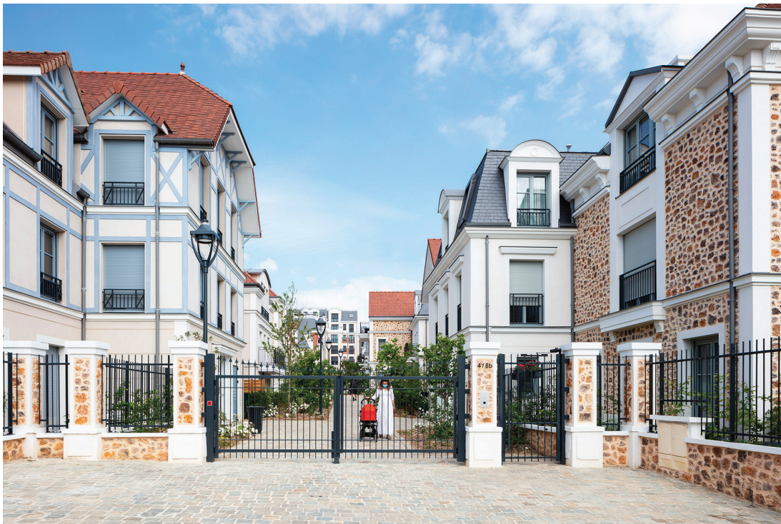
Allée de Meudon - CLAMART | 92