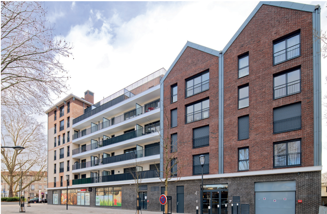
4 boulevard Carnot - ALFORTVILLE | 94