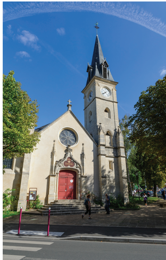
Église Saint-Léonard dans le centre-ville