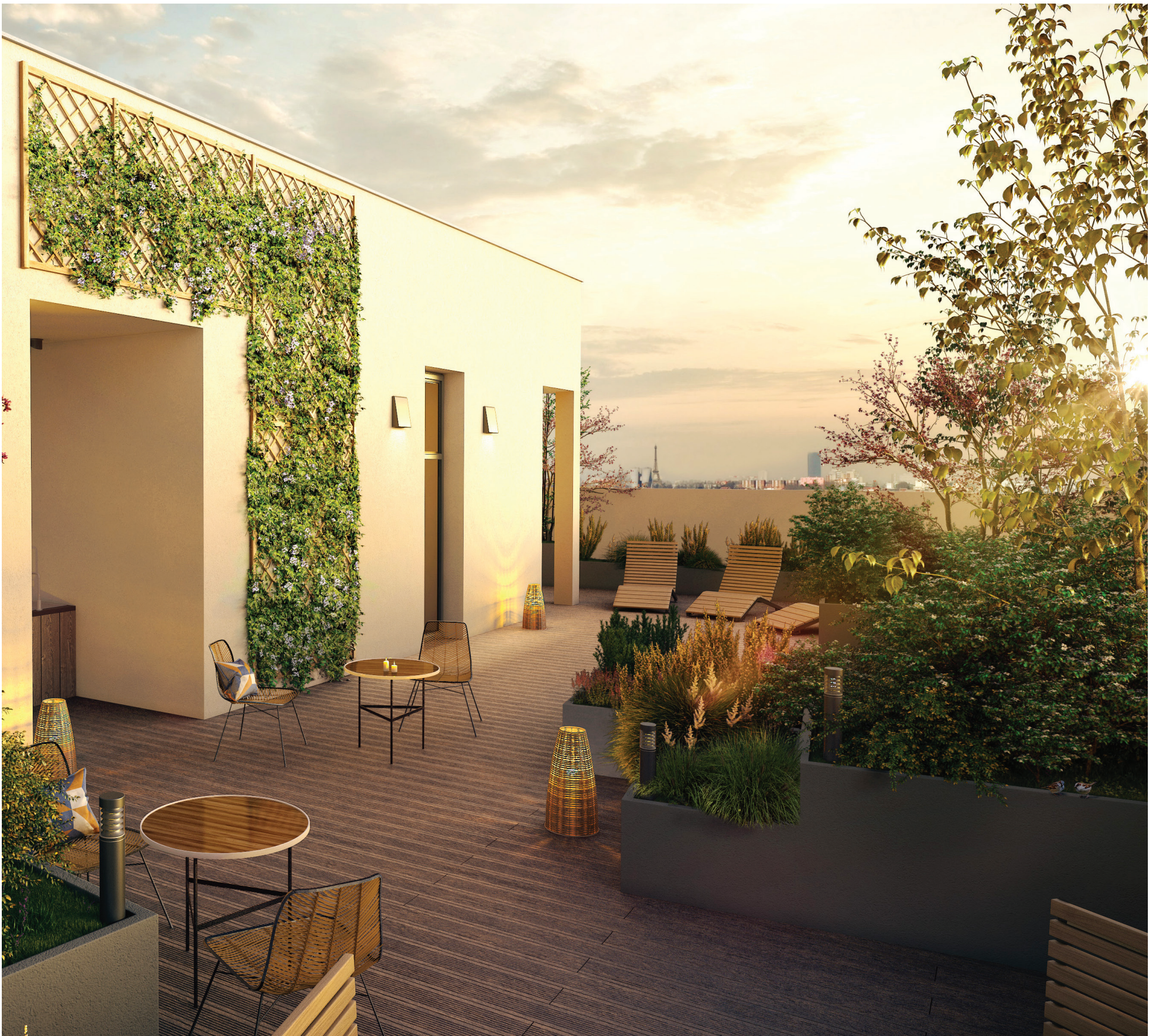
Vue de la terrasse partagée