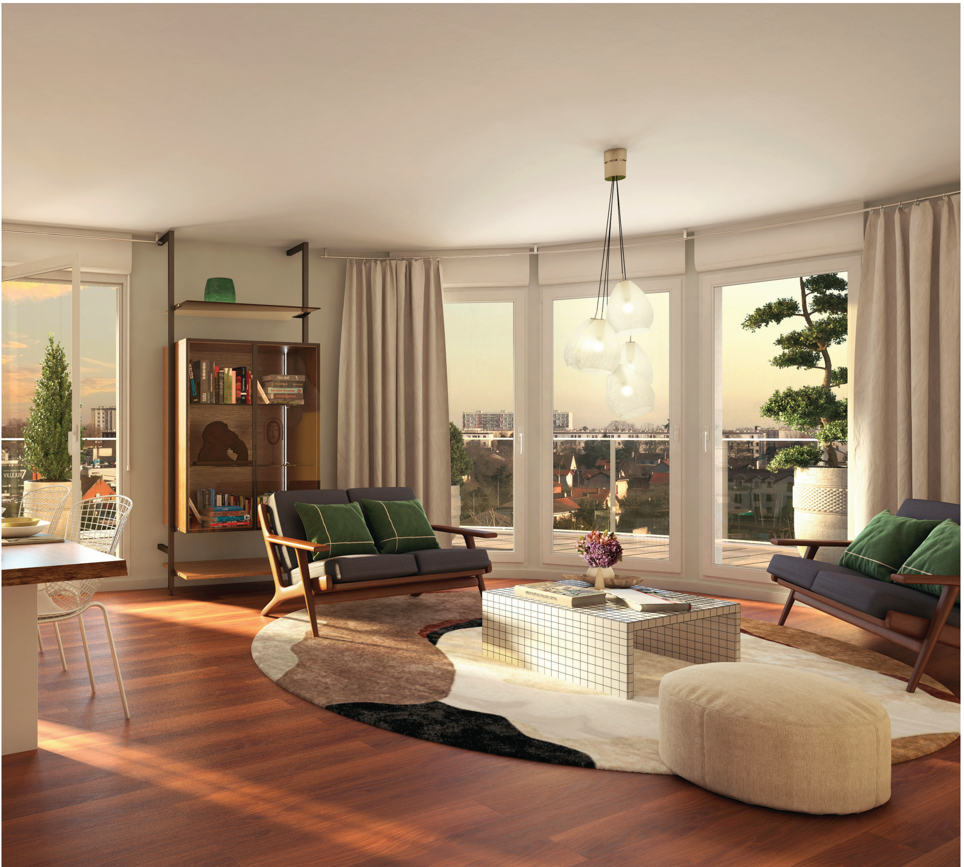
Vue d'un séjour 3 pièces