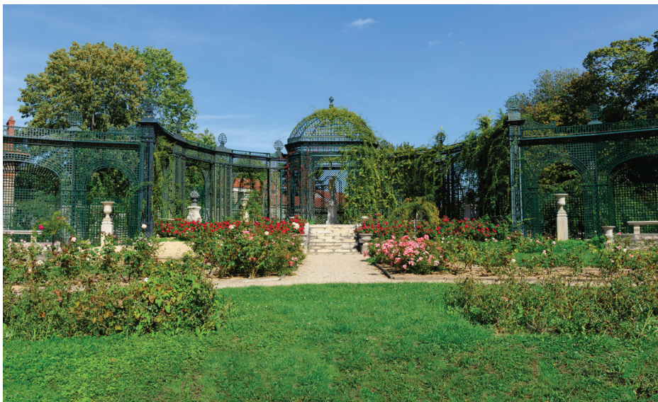
Parc Départemental de la Roseraie