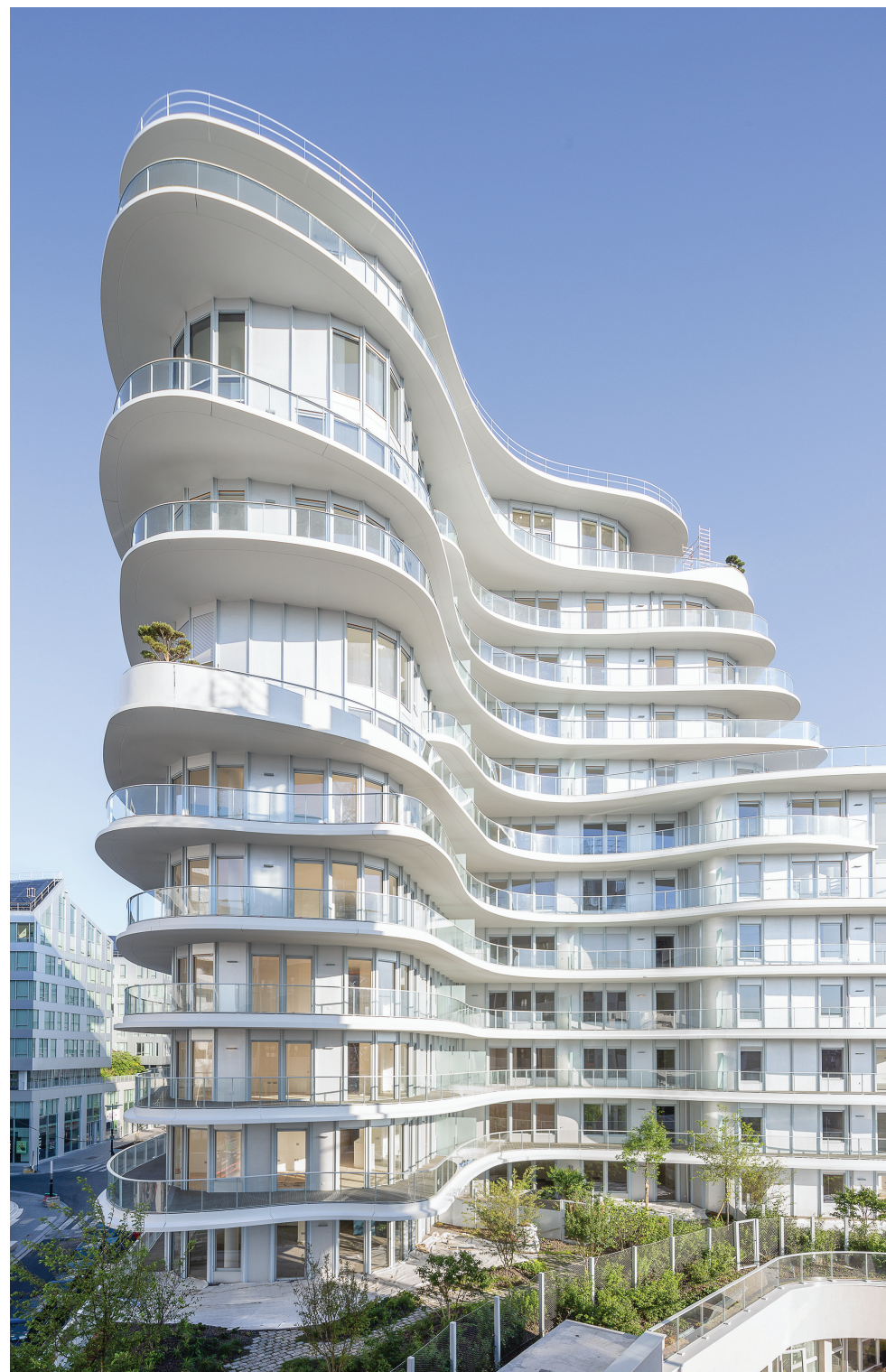
Unic - PARIS 17

Sources : *Google Maps - **Société du Grand Paris. - Emerige, société par actions simplifiée au capital de 3 457 200 €, immatriculée au RCS de Paris sous le numéro 350 439 543 - Siège social : 121 avenue de Malakoff 75116 Paris - Architecte : DGM & Associés - Perspectivistes : Atelier 74, InTime - Crédits photos : Grégoire Crétinon, Franklin Azzi Architecture, Jérémie Léon - Illustrations non contractuelles à caractère d'ambiance. Document et informations non contractuels - Réalisation : markus - 04/2022