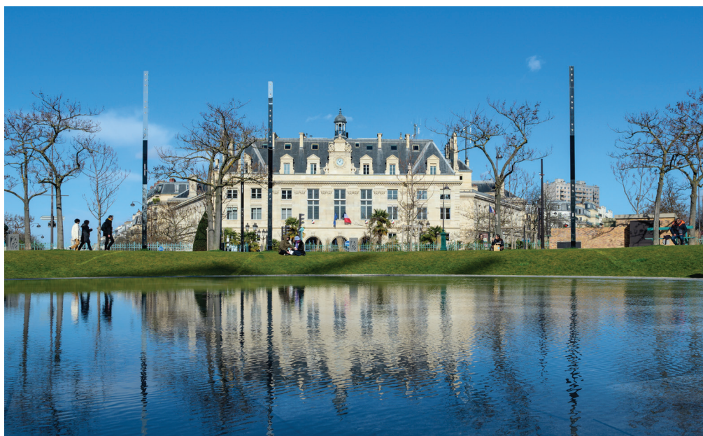
La place d'Italie à Paris