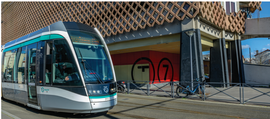
Tramway ligne 7 et métro Louis Aragon