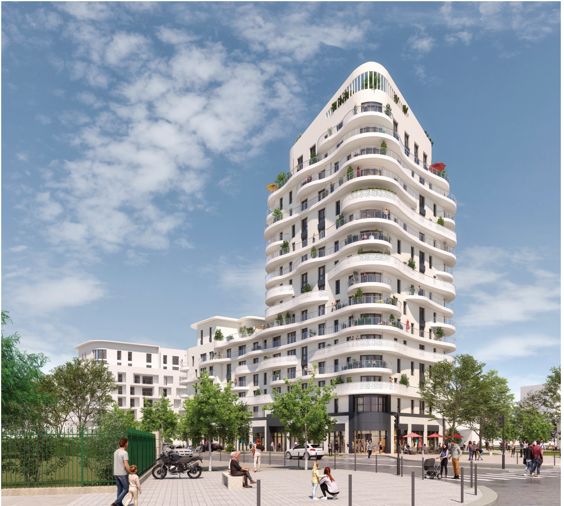
Vue de la place commerçante