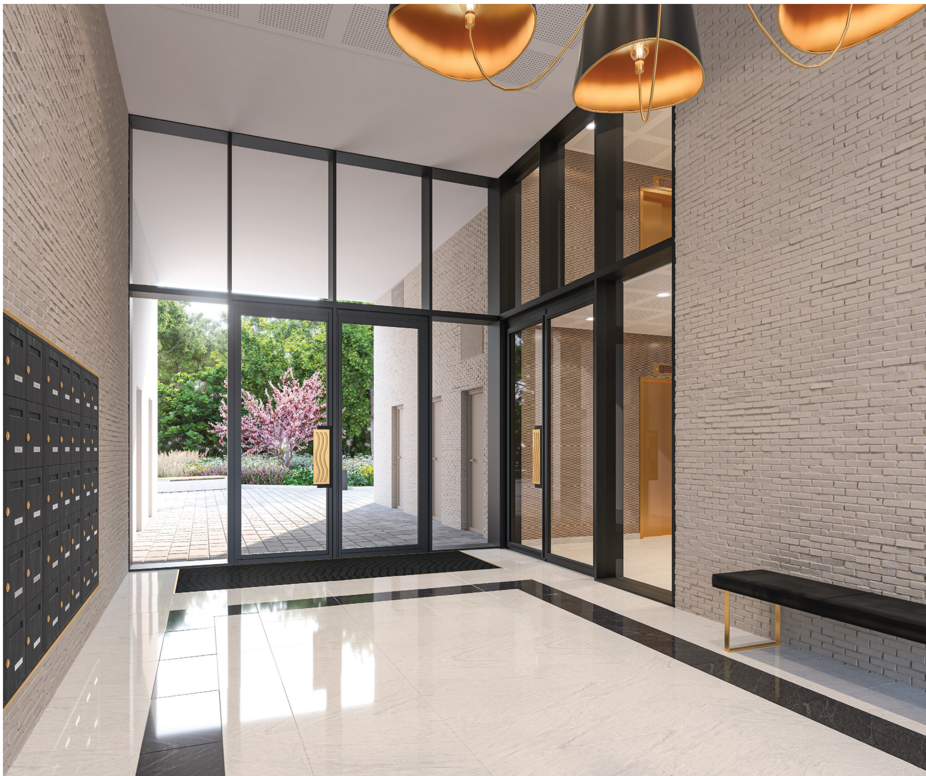
Vue depuis le hall