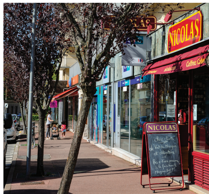
Commerces du centre-ville