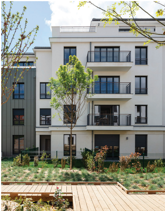
Rue Roussel - SAINT-MAUR-DES-FOSSÉS | 94