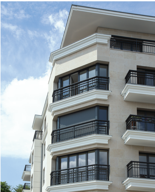
3 rue Jacques Decour - SURESNES | 92