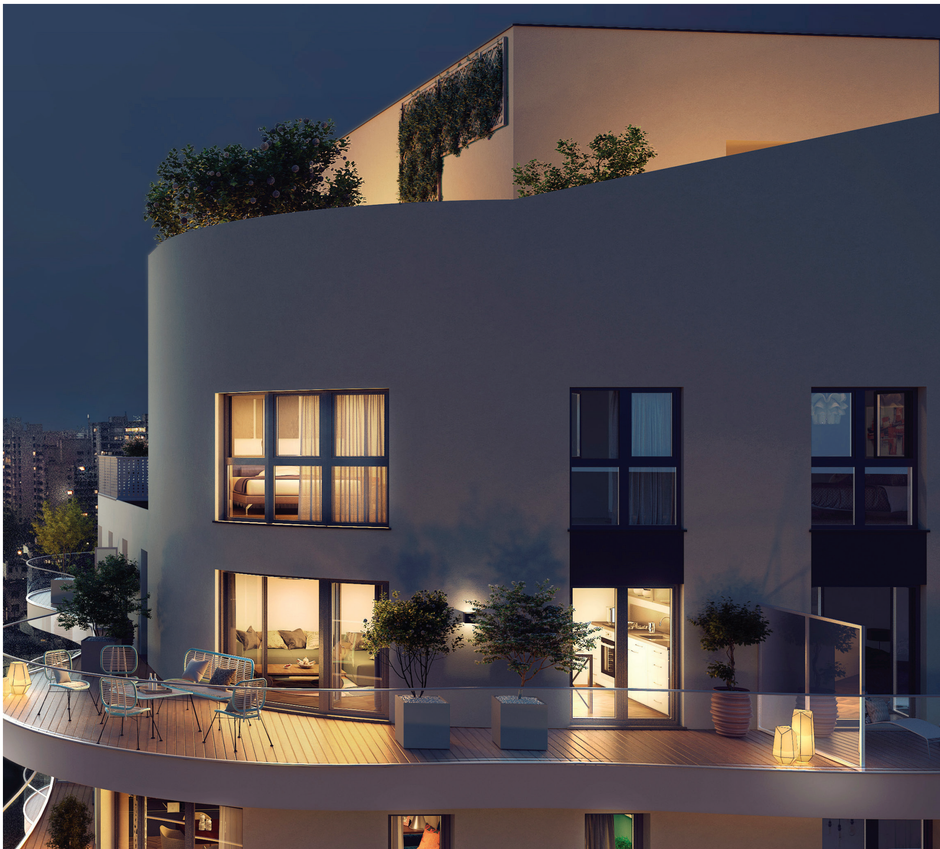
Vue d'une terrasse