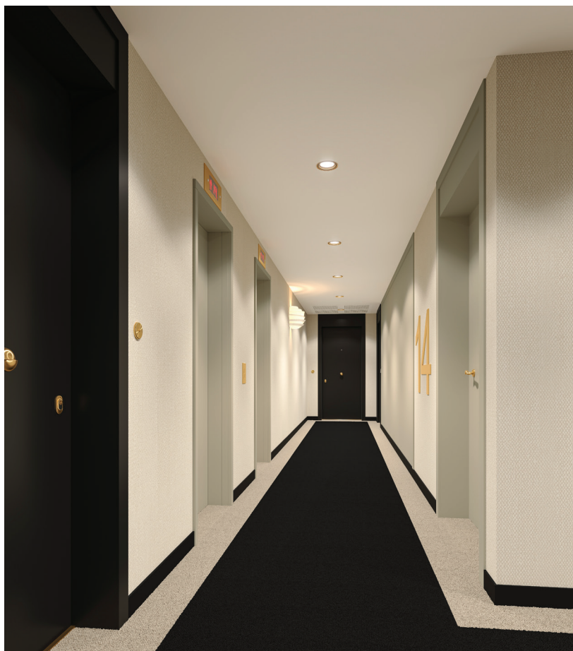
Vue d'un palier d'étage