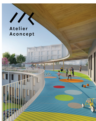
Le groupe scolaire