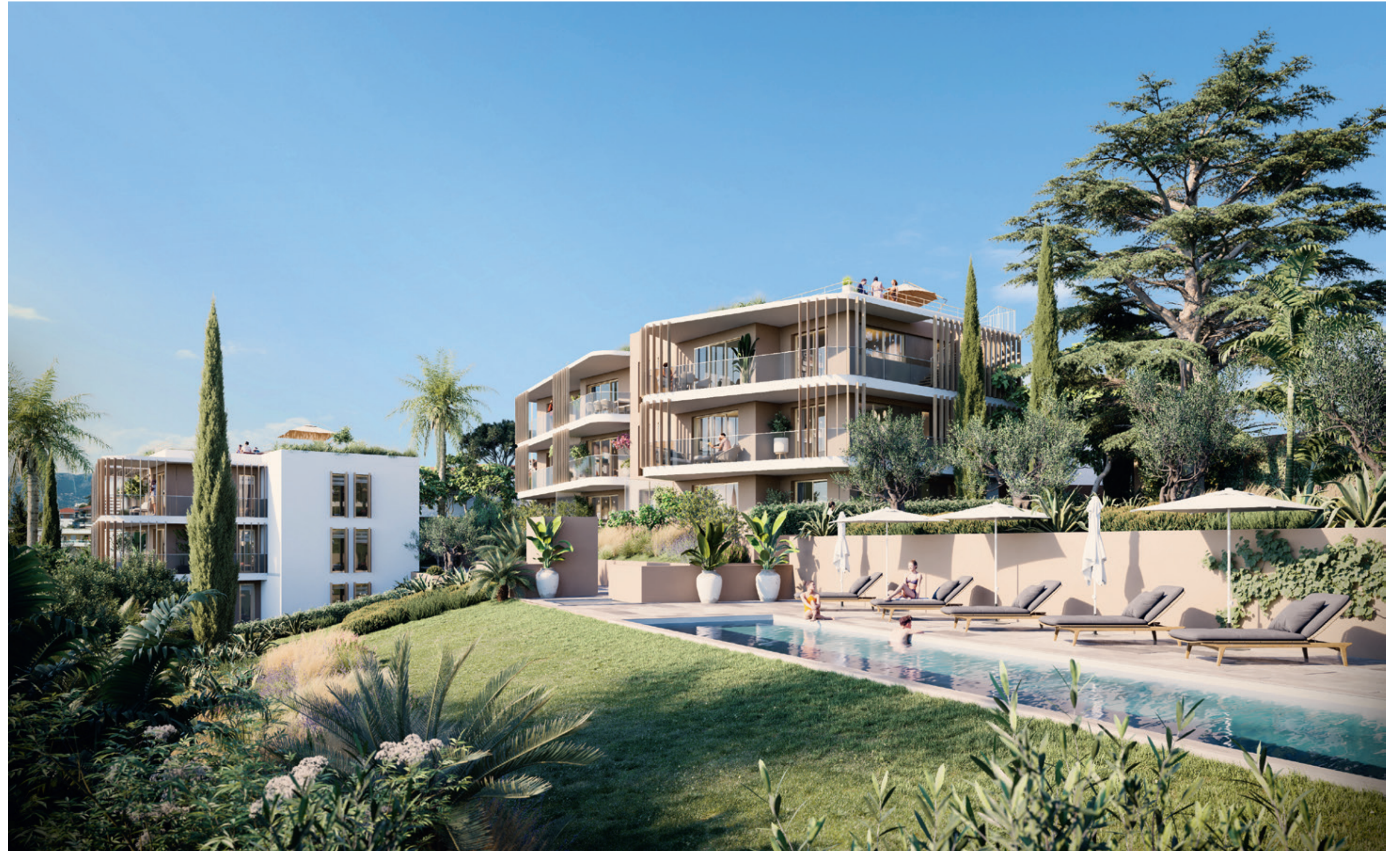
Vue depuis l'espace piscine sur les bâtiments A et B