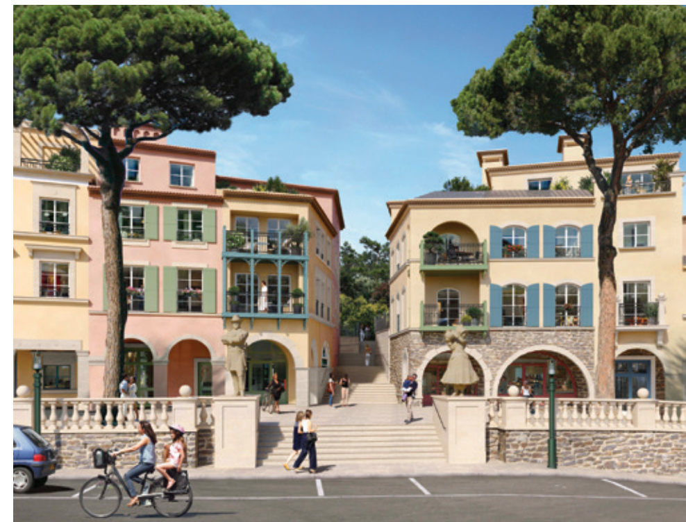
Chemin des Comtes de Provence - LE ROURET | 06