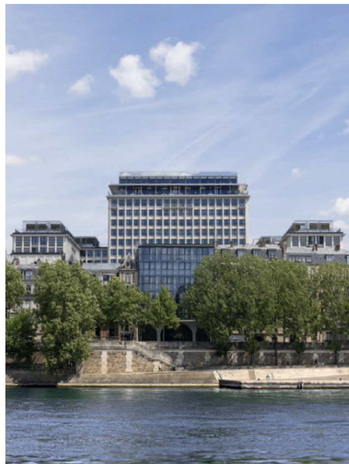
Morland Mixité - PARIS | 4