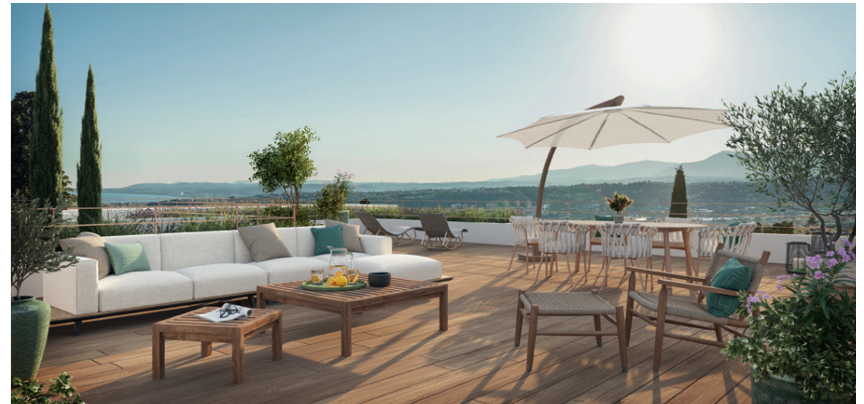
Vue d'un toit-terrasse privatif végétalisé