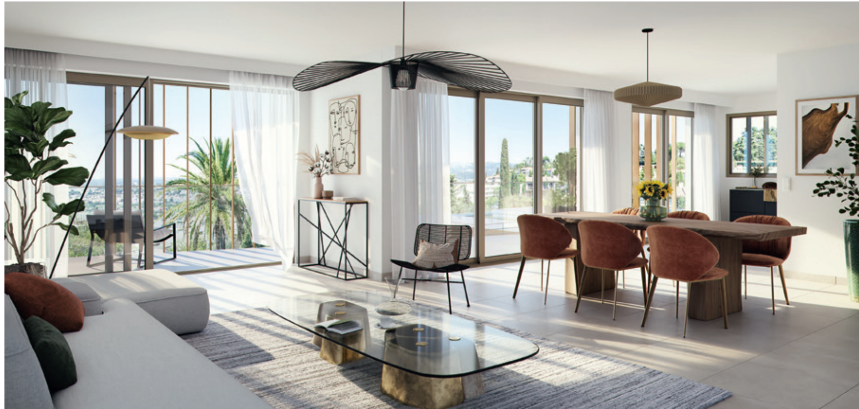
Vue intérieure 5 pièces aux larges baies vitrées