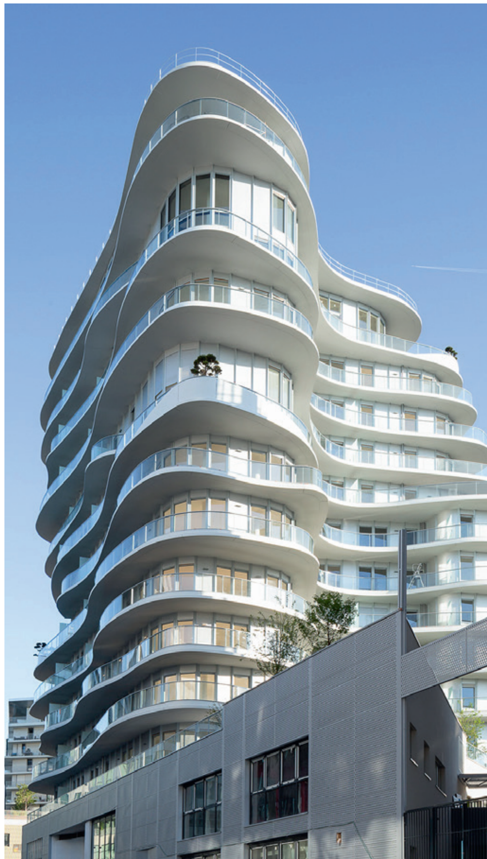
Unic - PARIS | 17