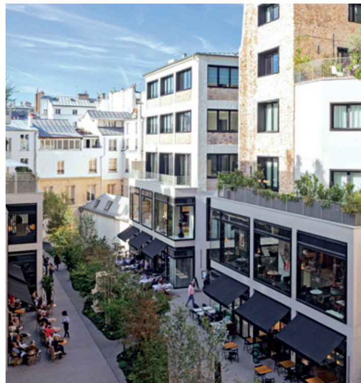
Beaupassage - PARIS | 7

Pour Emerige, chaque nouveau projet immobilier répond à une quête d'exigence en matière de qualité et de durabilité architecturale. Tous conçus comme des lieux de vie partagés, ils visent en priorité la satisfaction des habitants et des usagers pour un mieux-vivre ensemble. C'est pourquoi le Groupe choisit de faire appel à des architectes, designers et artisans de talent. À travers ces hommes et ces femmes visionnaires, il contribue à ériger une ville plus innovante, plus durable et plus généreuse.