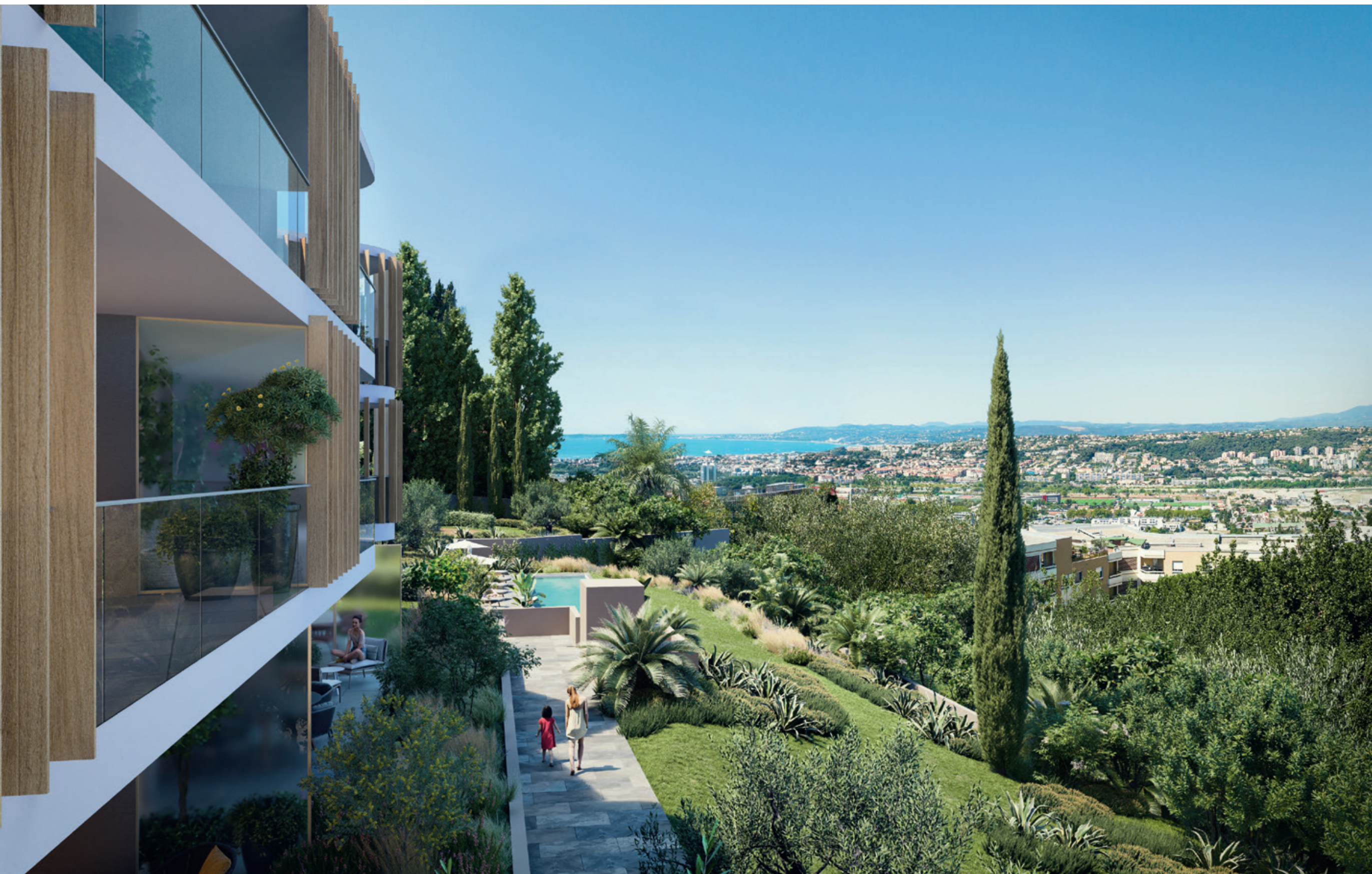
Vue depuis le bâtiment A sur la piscine et la Baie des Anges