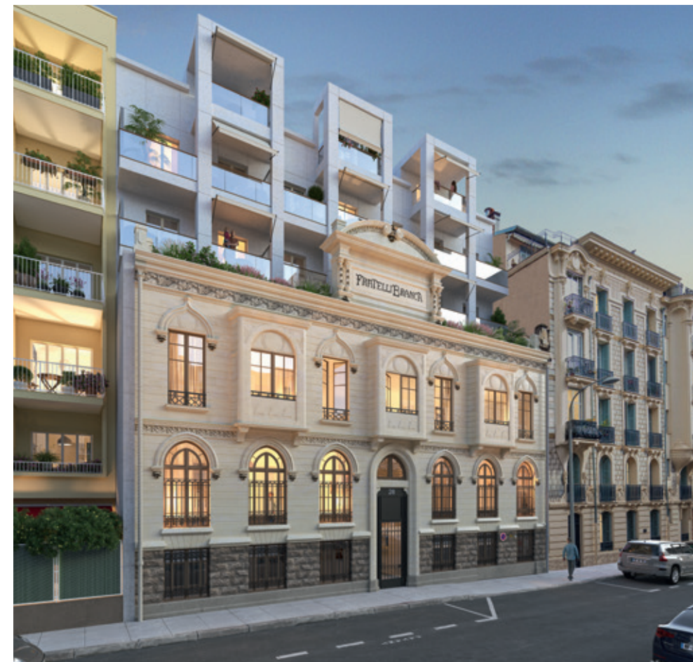
28 Berlioz - NICE | 06

Emerige, société par actions simplifiée au capital de 3 457 200 €, immatriculée au RCS de Paris sous le numéro 350 439 543 - Siège social : 121 avenue de Malakoff 75116 Paris. Architecte : Jean-Paul Gomis - Perspectivistes : Miysis et Visual-FL - Illustrations non contractuelles à caractère d'ambiance. Document et informations non contractuels - Réalisation : © commeuneimage.net - 09/2022