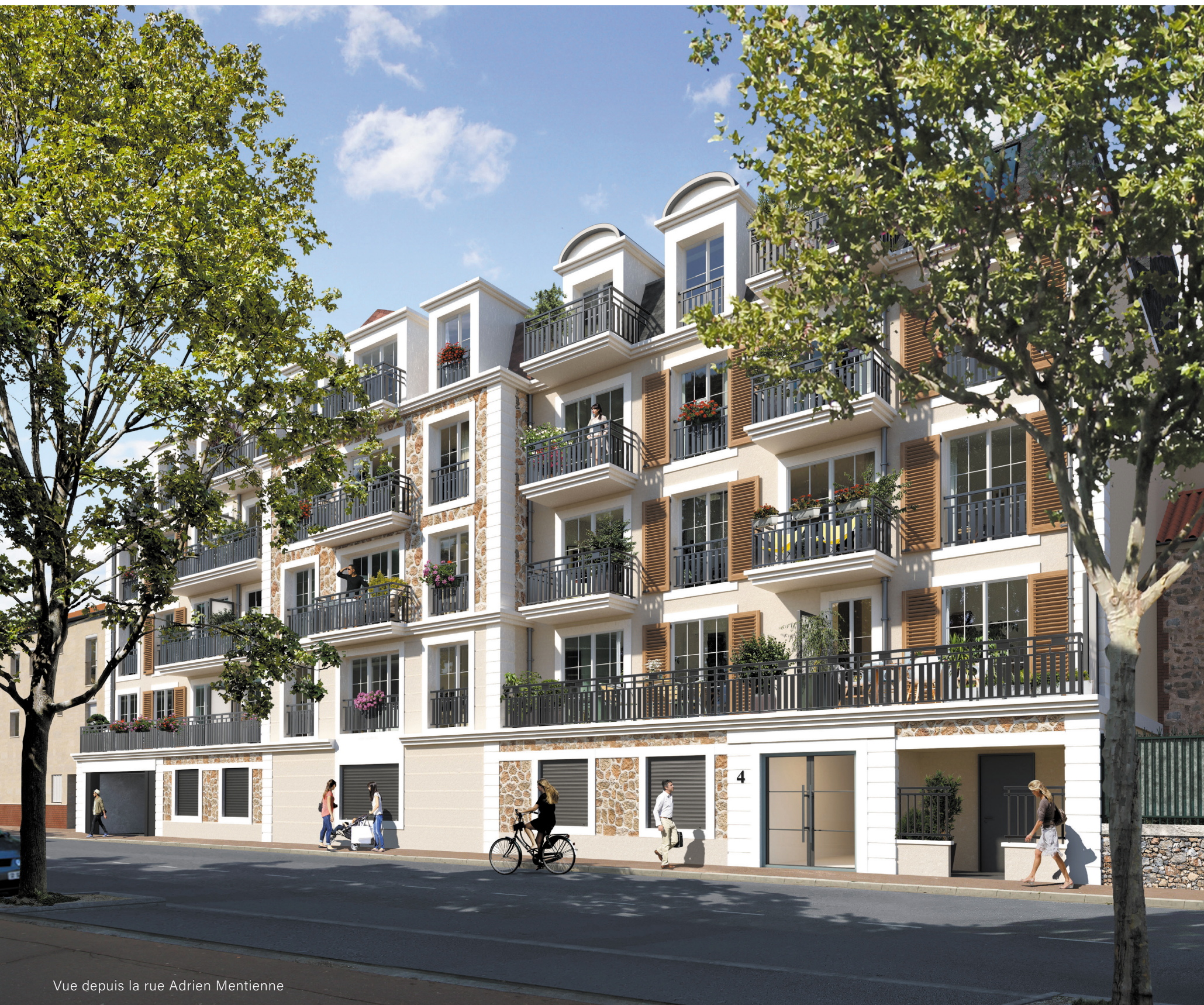
Vue depuis la rue Adrien Mentienne