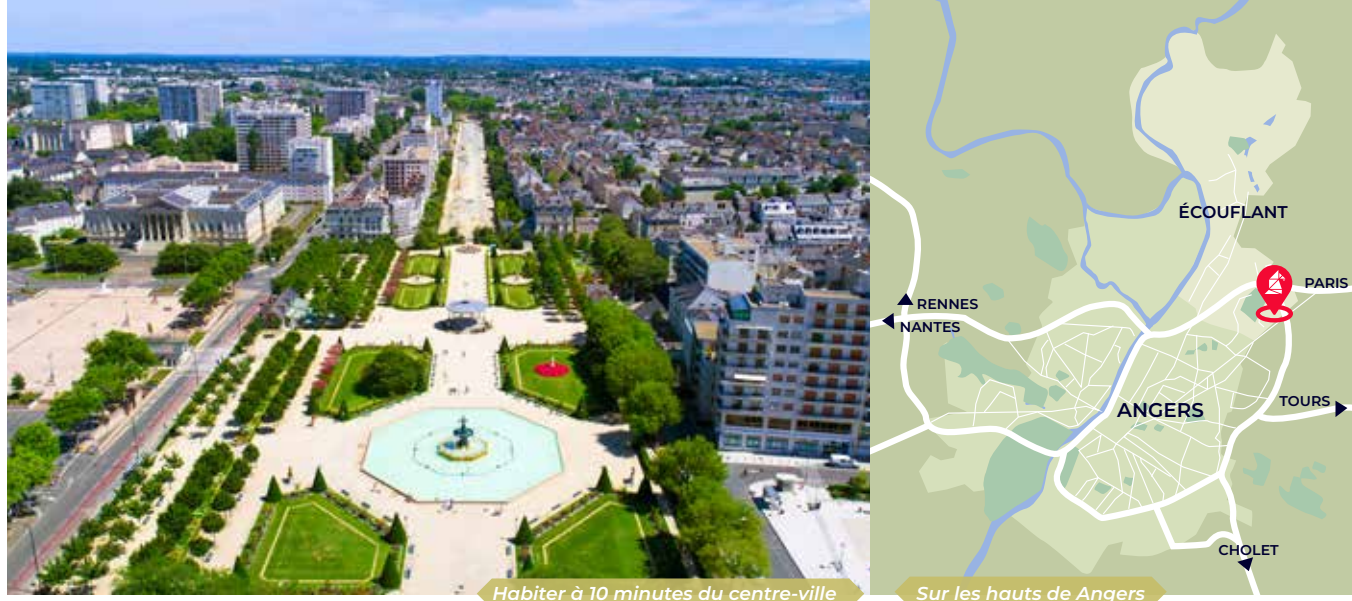
Habiter à 10 minutes du centre-ville