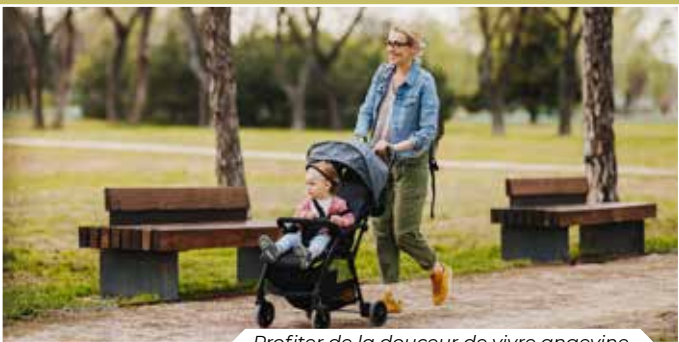
Profiter de la douceur de vivre angevine