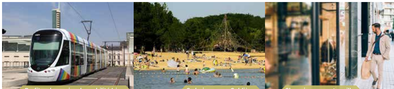
Profiter du service de mobilité Irigo

Angers est la deuxième métropole et le cœur géographique des Pays de la Loire. Avec ses 302 000 habitants, l'agglomération dispose de tous les équipements des grandes villes en termes de santé, de culture, de sports et de loisirs. Très vivante et à taille humaine, cette capitale régionale est très largement reconnue pour sa qualité de vie – « la ville où il fait bon vivre » – et sa dynamique de croissance importante.