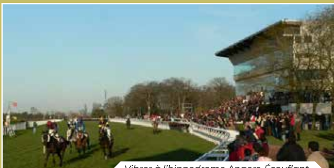
Vibrer à l'hippodrome Angers-Écouflant